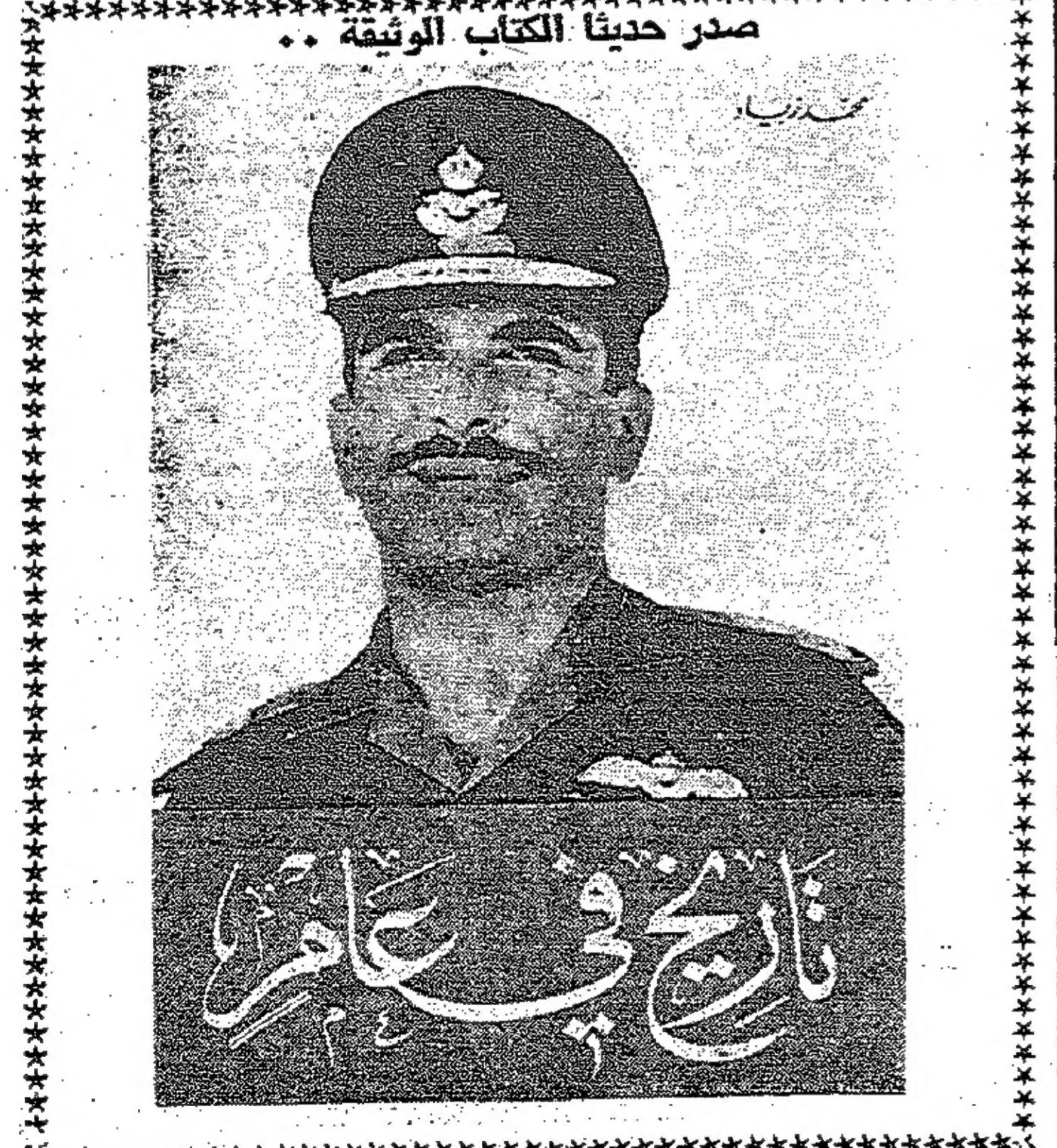
صدر حديثاً الكتاب الوثيقة ..

نداء للمواطنين من مدير الامن جانا من اللواء من ابو نوار مدير الامن العام النداء التالي : بمناسبة ابتداء موسم الاطوار ارجو من جميع البقية على صفحة ٦ عمود ٢